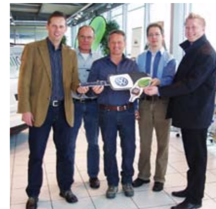
Schlüsselübergabe der 5 Erdgas VW Touran bei der Centralgarage in Uznach an egli jona ag.

MW: Ja, vollumfänglich. Sie sind sehr zuverlässig, komfortabel und sparsam.