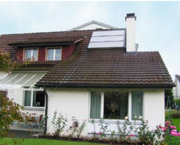
Die kleine Solarzellenfläche von 6 Quadratmetern genügt, um das Warmwasser im EFH Indermaur aufzuheizen.

Bei einer Überbauung mit vier neuen Einfamilienhäusern in Jona wurde die Variante von Erdgas und Sonne für Heizung und Warmwasser gewählt – ebenso bei einer Umstellung von Erdöl zu Erdgas in einem Privathaus in Jona.