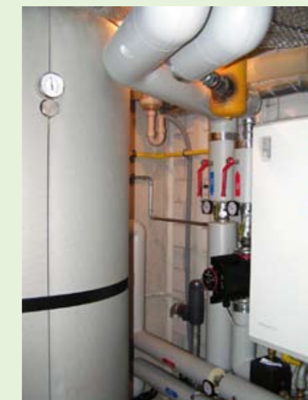
Auf kleinstem Raum ist die Gasheizung für die einzelnen MFH untergebracht.

Die MFH werden über riesige unterirdische Garagen erschlossen. Und dort sind auch die technischen Räume und damit die Heizungsanlagen untergebracht. Auf kleinstem Raum sind hier