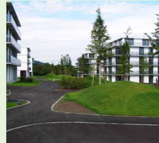
Auf einer grünen Wiese ist in zweieinhalb Jahren die Überbauung Rotbachpark mit 226 Wohnungen entstanden.

Erstellt wurde die grosse Überbauung Rotbachpark in Lachen durch die ARWA Immobilien AG als Totalunternehmer. Die Architektur stammt von E. Wanger AG, Architekten HTL, aus Rüslikon. Auf der einstmaligen grünen Wiese mit einem auffälligen Wohnhaus und einem noch auffälligeren Schuppen ist ein richtiges kleines Dorf entstanden. Dieses besticht durch eine originelle und lichtdurchflutete Anordnung der unterschiedlich grossen Mehrfamilienhausbauten mit vielen dazwischenliegenden Grünflächen. Die einzelnen Häuser beherbergen zwischen drei und 17 Wohnungen mit 2, 3 1/2, 4 1/2 und 6 1/2 Zimmern oder 3 1/2 Zimmer Attika. Die ganze Überbauung wurde in verschiedene Baufelder eingeteilt. Vier Pensionskassen haben diese Baufelder käuflich erworben.