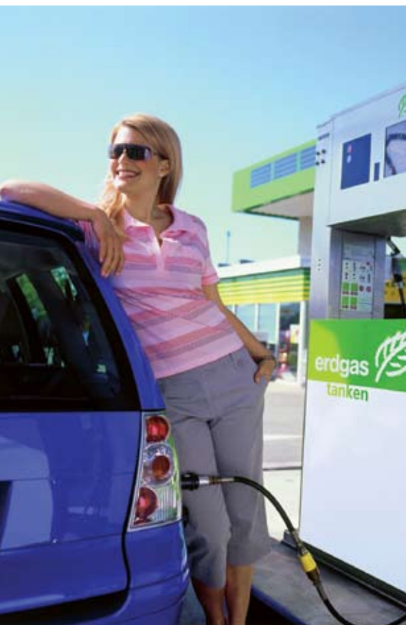
Sauberer Autofahren – der neue Erdgas-Katalysator macht es möglich.

Schweizer Motorenforscher haben einen neuartigen Erdgas-Katalysator entwickelt. Entstanden ist laut den Forschern das wohl sauberste Auto der Welt.