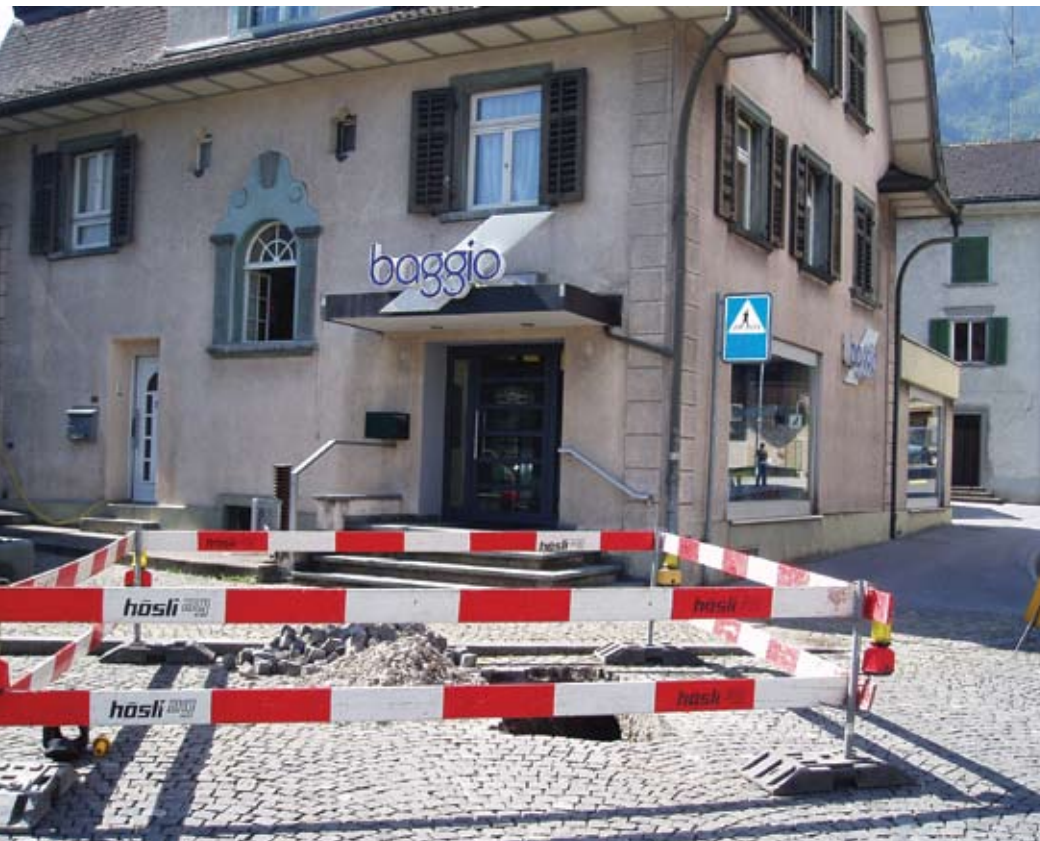
Auf dem mit Kopfsteinpflaster gedeckten Hirschenplatz musste vor der Baggio-Liegenschaft eine Grube zur Hauptleitung ausgehoben werden.

Die Firma Baggio, Fenster und Türen, Niederurnen, hat vor rund einem Jahr eine neue Erdgasheizung installiert. Der Kunde ist mit der Auftragsabwicklung durch die Erdgas Obersee und mit dem Betrieb der neuen Gasheizung sehr zufrieden.