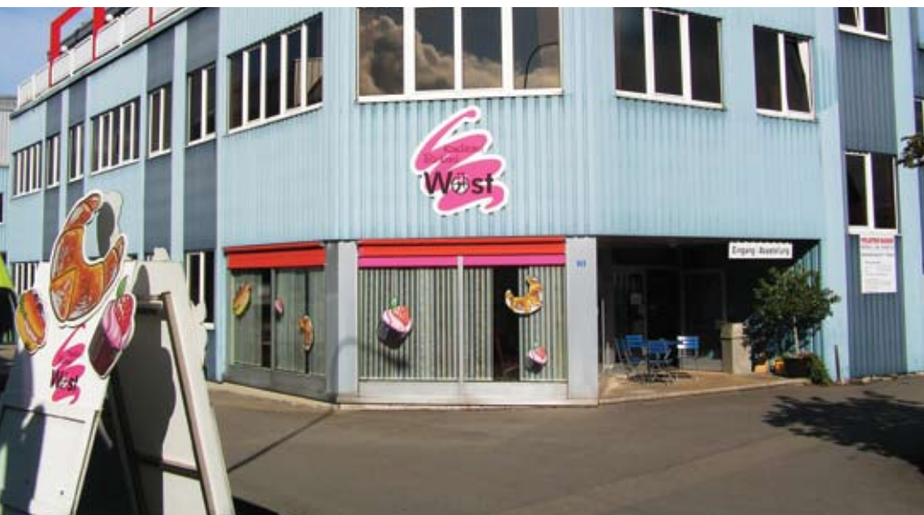
Die Bäckerei-Konditorei Wüst in Wangen konnte nun an das Erdgasnetz angeschlossen werden.

Nachdem die Erdgas Obersee das Industriegebiet Leuholz in Wangen mit einer Erdgasleitung erschlossen hat, wurde die Bäckerei-Konditorei von Remo Wüst auch auf Erdgas umgestellt. Die Energiekosten sind nun deutlich günstiger.