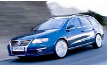
VW Passat Variant TSI EcoFuel

Die neuen Erdgasautos mit 150 PS Turbomotoren.