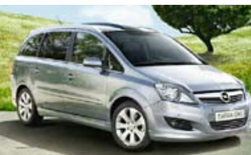
Opel Zafira CNG Turbo

Wer umweltschonend und günstiger fahren und dennoch nicht auf den gewohnten Komfort verzichten will, der tankt Erdgas und Biogas. Im Schweizer Durchschnitt sind Erdgas und Biogas an der Tankstelle 20 bis 30 Prozent günstiger als Benzin.