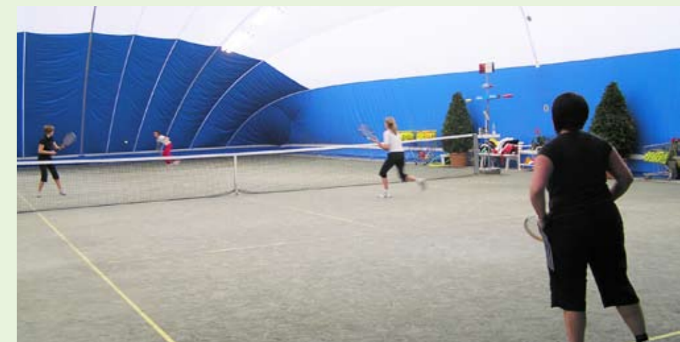
In der grosszügigen Halle lässt sich auch im Winter spielen