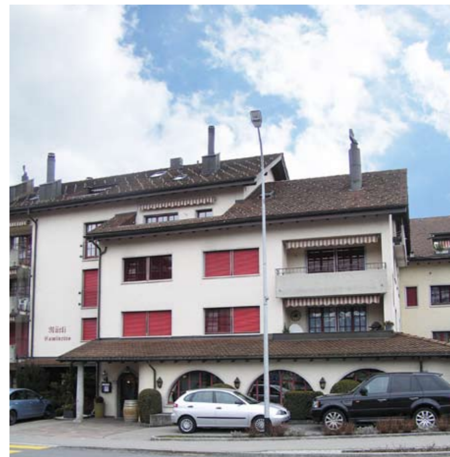
Auch die Liegenschaft an der Oberdorfstrasse 15 mit dem Ristorante Caminetto wurde auf Erdgas umgestellt.

Erstaunlicherweise ist kein grosses Interesse der Mieterseite vorhanden. Da die Mieter/Mietinteressenten keinen grossen Einfluss auf bestehende Wärmesysteme haben, wird diese Frage selten erörtert. So gut wie nie wird das Thema Isolation des Gebäudes angesprochen.