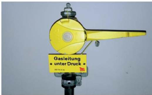
Verzapfte Hausanschlussleitung im Haus

Die Leitung muss dabei direkt nach Gebäudeeintritt und nach der Hauptabsperrramatur verschlossen (verzapft) werden ( siehe Foto ).