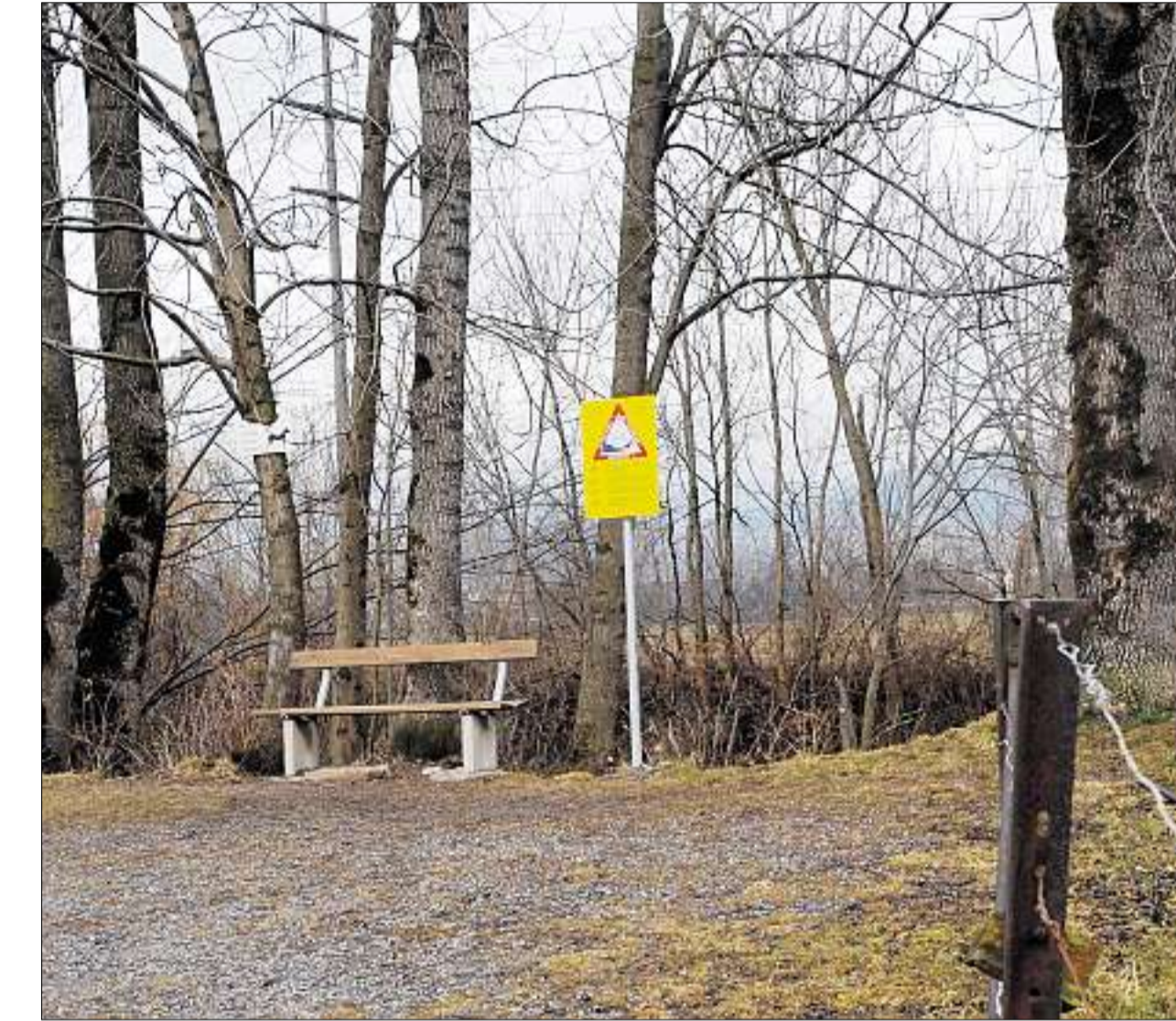
Von Galgenen direkt nach Wangen: An dieser Stelle soll bald ein Steg über die Wägitaler Aa führen.